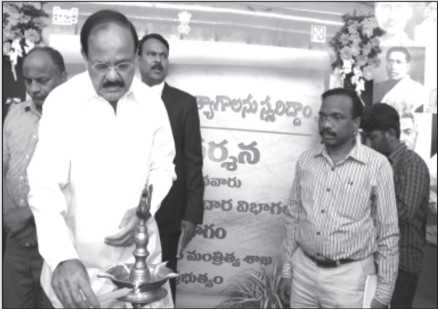
70 సంవత్సరాల స్వాతంత్ర్య దినోత్సవ వేడుకలపై ఫోటో, పుస్తక ప్రదర్శనను హైదరాబాద్ నెక్లెస్ రోడ్డులోని పీపుల్ ప్లాజా వద్ద ఆగస్టు 19, 2016న ప్రారంభించిన కేంద్ర సమాచార, ప్రసారశాఖా మంత్రి శ్రీ యం. వెంకయ్య నాయుడు.